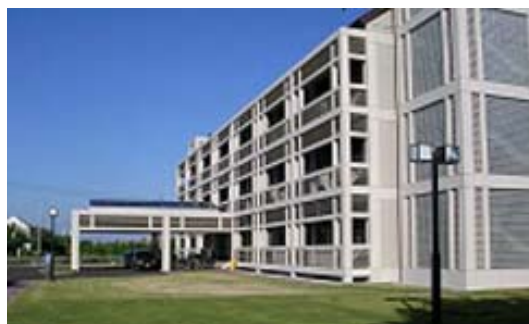
JICAが支援しているスラバヤ工科大学